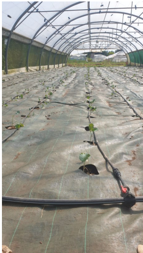
Plants de chou

Plants de tomates Depuis quelque temps, nous cultivons le chou-fleur et le chou brocolis sous serre parce que nous n'arrivons pas à les faire arriver à maturité, et avec un calibre suffisamment homogène en plein champ. La culture sous serre nous permet donc de régler ce problème, de contrôler l'arrosage et aussi l'enherbement grâce à des bâches. Le résultat étant concluant, nous testons cette année la culture du chou rouge sous serre.