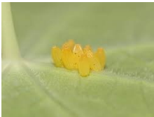
Œufs piéride du chou

Bonne surprise cette année, nous avons eu des chenilles de la piéride du chou infectés par des larves auxiliaires (=qui lutte contre les ravageurs). Après quelques recherches, nous nous sommes rendu compte qu'il s'agissait d'une mouche qui pond dans la piéride. Leurs larves se développent dans les chenilles et en sortent à maturité en tuant ces dernières. Ce phénomène permet une régulation naturelle des populations de piéride du chou.