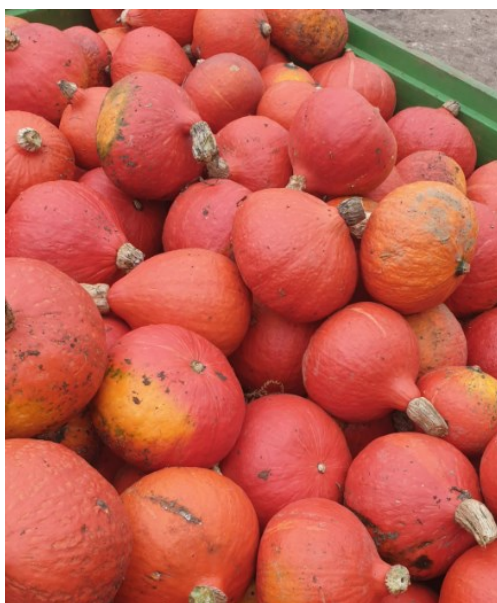
Récolte des potimarrons du lundi 14 octobre !