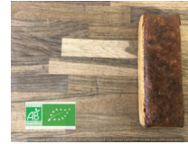
Le petit épeautre

Abonnez-vous dès maintenant ! Infos et tarifs en 2ème page de l'hebdo.