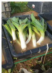
Lavage des poireaux