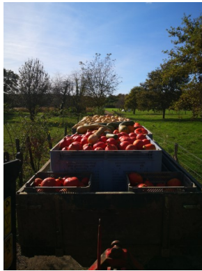
Transport des courges

Cette année la récolte a eu lieu un peu plus tardivement que les années précédentes, car avec la météo pluvieuse et fraîche nous avons attendu qu'elles gagnent en maturité. Cependant, nous ne pouvions pas attendre plus longtemps, car dès lors que les feuilles jaunissent cela est signe que la courge ne mûrit plus.