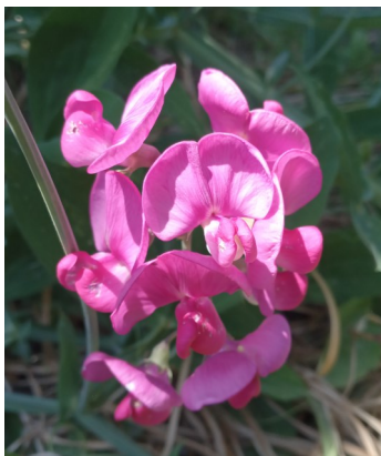
Pois de senteur