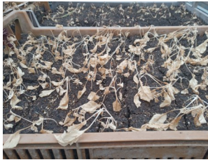
Plants de chou secs

Les dégâts dans les chambres froides ont été moindre car ceux-ci ont gardé une certaine inertie de fraîcheur et nous n'avons eu à déplorer que la perte de quelques cagettes de fruits.