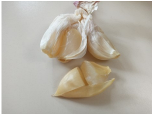
Gousses d'ail translucides

Avec des températures à l'ombre avoisinant les 35°C, il a fait une chaleur extrême dans la serre et cela a eu pour conséquence de « griller » les semis qui étaient présents et de « cuire » la récolte entière d'ail. Si vous avez reçu de l'ail dans votre panier en S28 vous recevrez une compensation dans le panier.