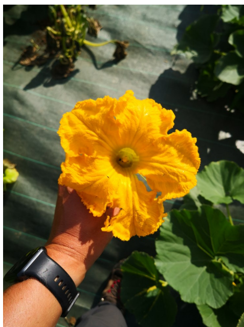
Fleur de courgette