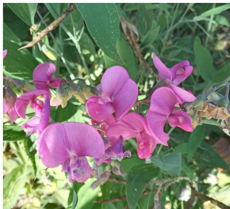
Pois de senteur