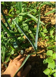
Désherbage sur le rang de poireau

Lorsque l'on désherbe, il est important d'enlever les racines des mauvaises herbes pour ne pas qu'elles repartent. Ce sont principalement des graminées (grandes herbes) et du chardon. Le sol était encore frais et pas trop dur ce qui a facilité le désherbage.