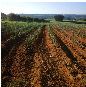
Le champ après désherbage