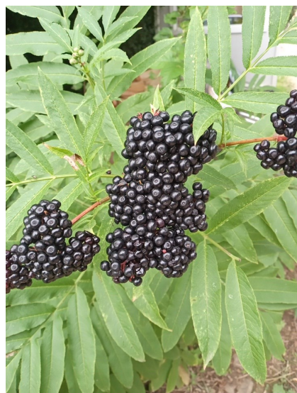
Sureau Hièble ( Sambucus ebulus )

Semaine 35 du 28 août au 1er septembre 2023