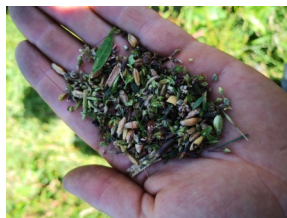
La récolte : un mélange de graines avec peu de lentilles