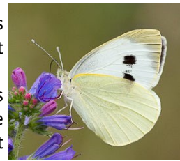
Papillon piéride du chou

Pour lutter naturellement contre ces invasifs du chou, nous utilisons du purin de tanaïs.