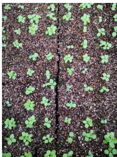
Levée de mâche en caisse de semis

Même dynamique du côté des tunnels, dans lesquels les cultures d'été vont progressivement laisser place aux cultures d'automne. Les équipes de jardiniers s'affairent aux semis de blettes, de mâche, d'épinard, de pourpier ou encore de mesclun.