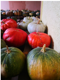
Stockage des premières variétés de courges

Nous avons ainsi débuté la récolte des courges la semaine dernière, récolte que nous poursuivons cette semaine avec les potimarrons et les butternuts