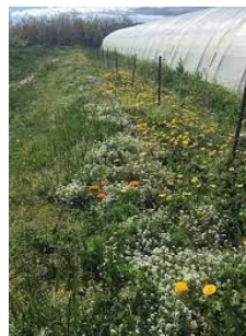
Exemple de prairie fleurie aux abords d'une serre maraîchère

Nous vous en avons déjà parlé dans des précédents hebdos, nous travaillons avec la chambre d'agriculture et un ensemble de producteurs afin de faire progresser collectivement les pratiques agricoles. Dans ce cadre, la chambre d'agriculture nous a amené la semaine dernière des semences de prairie fleurie durable afin que tous nous les semions aux abords de nos cultures, dans l'objectif de créer un écosystème ultra local et des habitats favorables à l'installation d'insectes auxiliaires (c'est à dire des insectes qui mangent ou détruisent d'autres insectes indésirables pour nos cultures). La mise en place de ce type de pratique permet notamment la réduction des produits de traitement, quand bien même ceux-ci sont naturels.