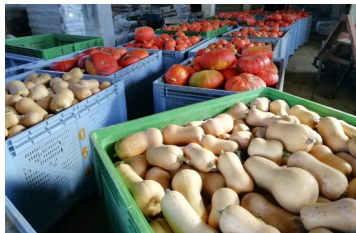
Petit aperçu d'une partie de la récolte de butternuts et potimarrons

Tout au long de la semaine dernière, nous avons poursuivi la récolte des courges. Elles sont désormais toutes récoltées et nous les stockons au fur et à mesure à l'abri du froid. Nous avons eu quelques frayeurs au moment de la plantation, étant donné que la sécheresse sévissait et que nous avons perdu un certain nombre de plants de courge puisque plantés en terrains non irrigables. Finalement, la récolte semble plutôt bonne, notamment pour les courges butternut et les potimarrons. À noter que nous avons cette année augmenté la production de ces 2 variétés suite au retour de certains d'entre vous. Avant stockage, chaque courge est pesée, triée puis rangée par poids et par calibre, afin de faciliter la distribution tout au long de l'hiver.