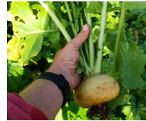
Petit aperçu de notre champ de navet et d'un de leur représentant.

Bien que les jardins soient situés dans un quartier plutôt résidentiel, nous avons régulièrement la visite nocturne d'amis chevreuils, qui résident certainement dans une ancienne carrière voisine désormais en friche. Il semblerait que ça soit les jeunes cœurs tendres des salades destinées à vos paniers qui provoquent leur visite ! Bien qu'ils nous inspirent de la sympathie, force est de constater que ces gentils quadrupèdes engendrent des dégâts conséquents. Nous avons donc contacté l'association de chasse de Bavans, non pas pour avoir recours à la méthode forte et radicale que nous pourrions imaginer, mais plutôt pour qu'ils nous fournissent le matériel nécessaire afin de protéger nos salades de ces broutages intempestifs, la prévention des dégâts aux cultures faisant partie de leur mission. Nous avons donc mis en place des piquets et fils métalliques qui permettront -normalement- de protéger nos cultures de ces insatiables appétits !