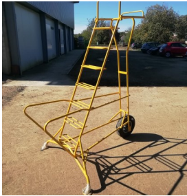
Brouette échelle Pour petits travaux et récoltes en hauteur

Nous vous en parlions déjà la semaine dernière, nous nous dotons actuellement de nouveaux matériels de manutention permettant plus d'efficacité et une meilleure ergonomie au travail. Deux nouvelles brouettes sont arrivées au cours de la semaine dernière. L'une permettra le transport de caisses de récolte et de semis tandis que l'autre sera plus spécifiquement dédiée aux travaux et à la récolte de fruits et légumes en hauteur.