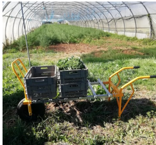
Brouette maraîchère simple Pour un transport optimisé de caisses de semis ou de récoltes

Autre endroit, autre chantier. La finalisation de notre nouveau système d'irrigation. Nous coulons ce lundi le premier des 9 regards qui nous permettront d'assurer le suivi et la maintenance du système d'irrigation. Comme vous le voyez sur la photo, il s'agit de regards de très grandes dimensions qui nécessitent un travail certain !