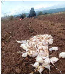
Caïeux d'ail préalablement dépiautés en attente de plantation

Les jours à venir s'annoncent également pluvieux, raison pour laquelle nous nous pressons ce lundi pour planter l'intégralité de nos bulbes d'ail (= caïeux) en plein champ. Ceux-ci passeront tout l'hiver en terre ainsi que le prochain printemps, pour finalement être récoltés aux alentours du mois de juin 2024. Au préalable, les caïeux reçus la semaine dernière ont été minutieusement dépiautés afin de séparer chaque gousse avant leur plantation, gousses qui se multiplieront lors de leur développement jusqu'à former de nouvelles têtes d'ail, que nous espérons dodues!