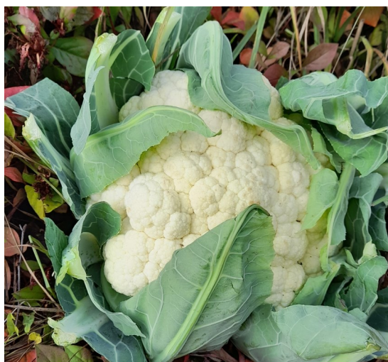
Chou fleur des jardins

Les Jardins d'IDÉES 5 bis rue Sous-Roches 25550 BAVANS 03 81 92 61 80 contact@jardins-idees.fr