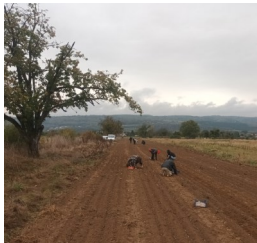
Plantation d'ail sous un ciel chargé et en atmosphère (très) humide

La semaine dernière, avant l'arrivée des pluies, Sébastien Lucie et Gaëlle (tous les 3 encadrant.es maraîchers) ont travaillé le sol de diverses parcelles pour y semer de l'engrais vert.