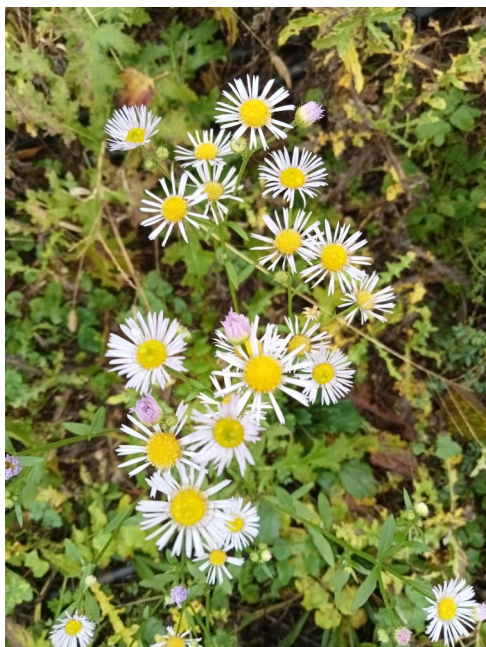
Vergerette du nord (Erigeron strigosus)