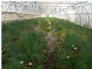
Les fenouils avant immersion complète et sauvetage... aussi...!

Côté récoltes, une grande partie des légumes d'hiver sont désormais stockés en chambre froide. Il nous reste encore quelques carottes en cours de récolte mais notre plus grande chambre froide de 300m 3 est désormais archipleine. A l'instar de nos amis les écureuils, nous n'envisageons pas d'hiberner mais les réserves sont faites !