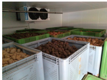
Ci-dessus, vue depuis le haut des piles de palox!