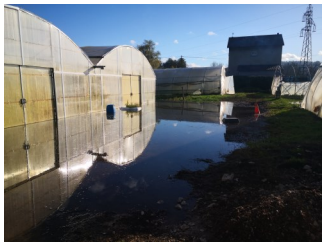
Un joli miroir d'eau devant la serre à semis (et dedans aussi...!)

Nous l'évoquions dans l'hebdo de la semaine dernière, nos craintes vis-à-vis des inondations se sont malheureusement confirmées. Néanmoins, ces dernières n'ont pas été trop importantes et n'ont pas engendré de trop gros dégâts sur les cultures. Quelques tunnels et bouts de champs se sont bien retrouvés sous l'eau mais les cultures sensibles n'ont heureusement pas été touchées. Nous avons tout de même fait en sorte de sauver in extremis quelques cultures qui se sont retrouvées immergées quelques heures, comme les fenouils du tunnel 1 par exemple.