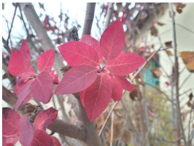
Arbre aux perruques

Semaine 48 du 27 novembre au 3 décembre 2023