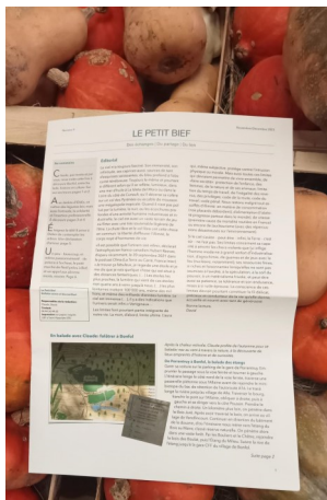
Plusieurs exemplaires Le Petit Bief s'installent au marché du jardin, en attente de curieux !

Si vous aurez l'occasion d'ici quelques semaines de découvrir un reportage à propos des jardins sur TV5 Monde (dont nous vous reparlerons très prochainement), vous trouverez cette semaine sur la page des hebdomadaires ( en cliquant ici ) un très bel article paru dans le journal Le Petit Bief, dans lequel figure notamment le témoignage d'Anaïs, salariée au jardin depuis juin 2022. Le Petit Bief, journal qui prend ses sources et inspirations tout près de chez nous! Petite présentation par l'intéressé :